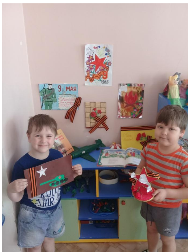
Наш уголок «День Победы»