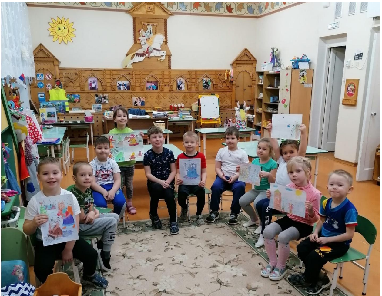
Викторина по зимним сказкам