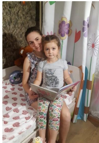
Викторина по творчеству детских писателей