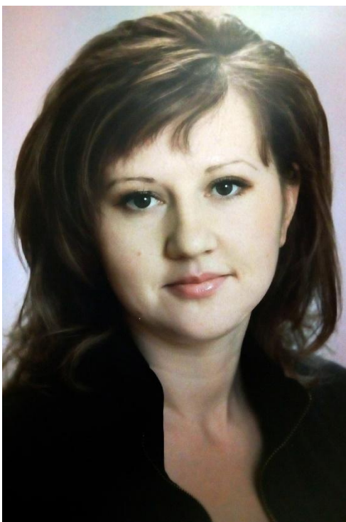
День воспитателя, сентябрь 2020г.